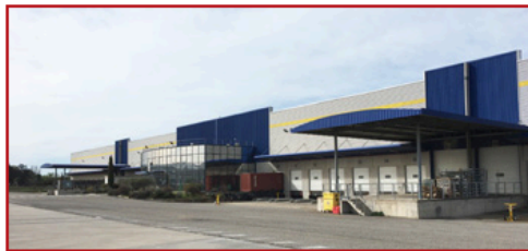
Deux des entrepôts de Gazeley à Saint-Martin-de-Crau sont occupés par Katoen Natie.